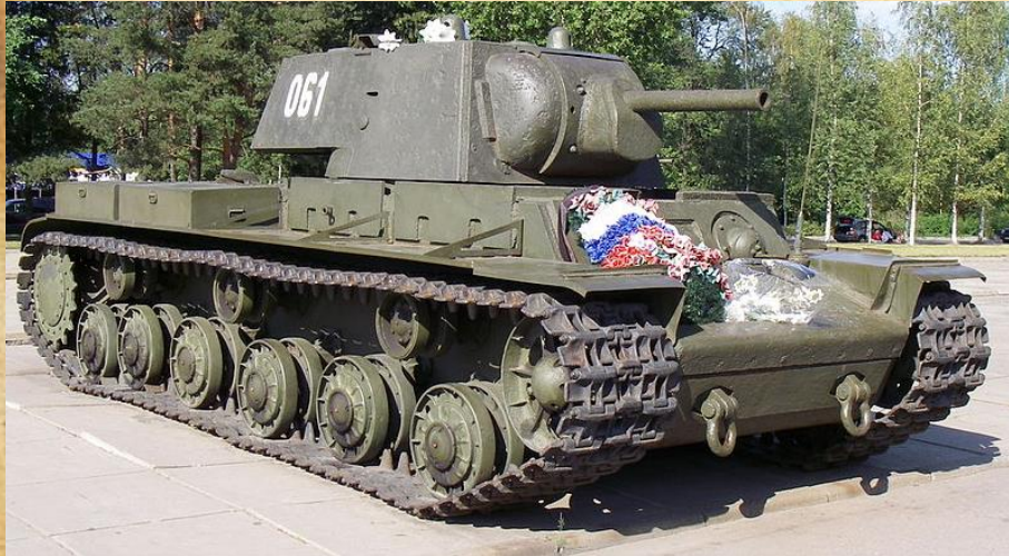
Средний танк Т-34 и тяжелый КВ-1

Перед началом войны советскими инженерами были созданы лёгкие танки Т-40 и Т-50, средний танк Т-34 и тяжелые КВ-1 и КВ-2. Они начали поступать в войска, но большую часть танкового парка составляли машины, созданные в 30-е годы, такие как лёгкие танки Т-26, БТ-5 и БТ-7, а также средние Т-28 и тяжелые Т-35.